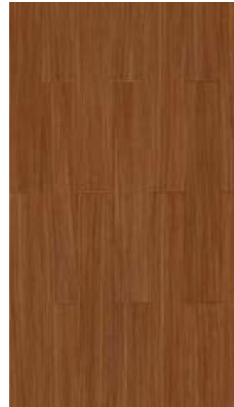
GA - QH - 4102