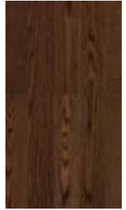
GA - SH - 3401