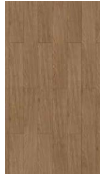
GA -QH -4103