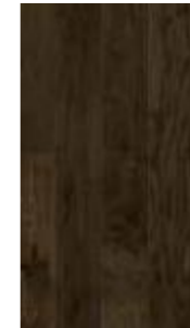
GA - SH - 2102