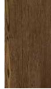
GA - SH - 1401