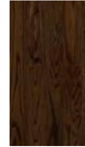
GA - SH - 2401