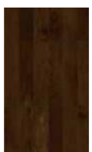
GA - SH - 2103