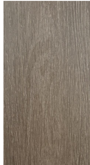
GA -QH -4101